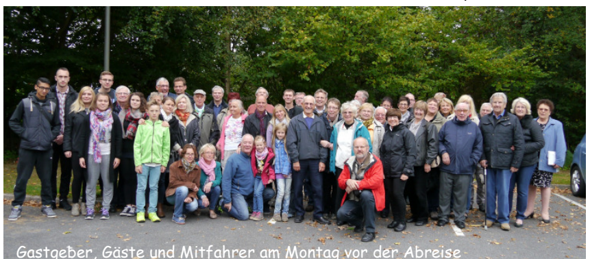
Gastgeber, Gäste und Mitfahrer am Montag vor der Abreise

Unterbringung: Alle Besucher vom Dorstener Freundeskreis Crawley (Vorstandsmitglieder und Partner) wohnten privat bei Vorständen der Crawley Town Twinning Association.