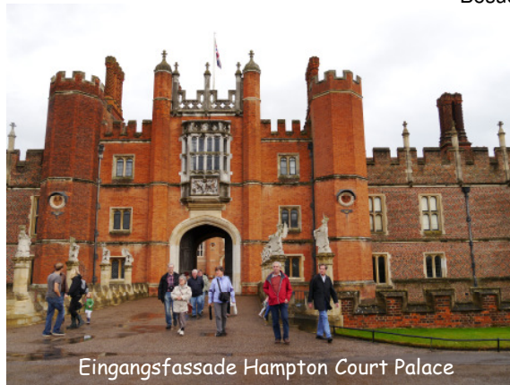
Eingangsfassade Hampton Court Palace

-komplex, zu dem über Jahrhunderte immer wieder etwas ergänzt wurde. Die meisten schafften es trockenen Fußes bis zum Schloß. Wegen des Regens wurden hauptsächlich die Räume besichtigt, den schönen Garten konnte man durch die Fenster „genießen“. Pünktlich vor dem Rückweg zum Bus hörte es auf zu regnen.